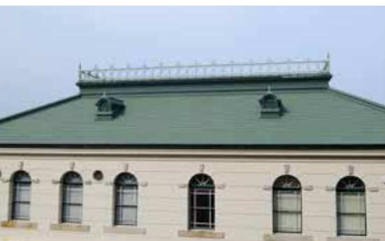
本館の大屋根に取り付けられたバラストレード Balustrade around the Main Hall roof