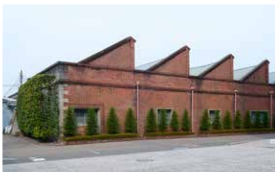
紡績工場の象徴、ノコギリ屋根の工場建物 The sawtooth roof of the factory building, symbolizing the spinning factory