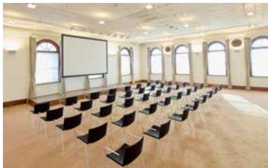
2階のレセプション・ホール The Reception Hall on the second-floor