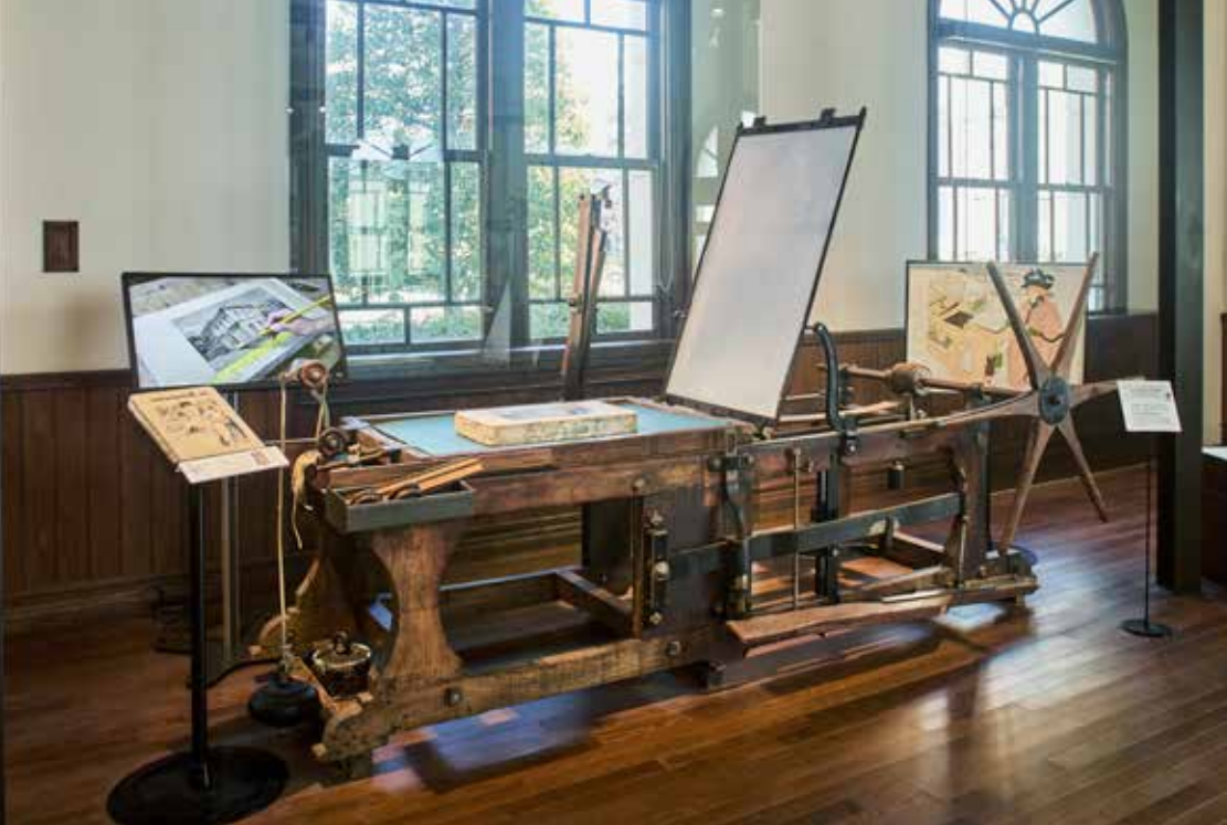
ゼネフェルダー石版印刷機(実機)