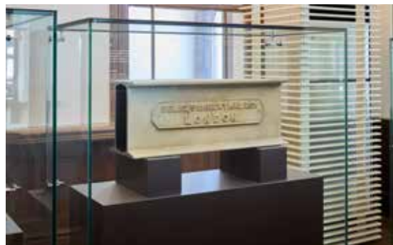
イギリスから運び込まれた鉄製の梁(複製) Steel beam brought from Britain (replica)