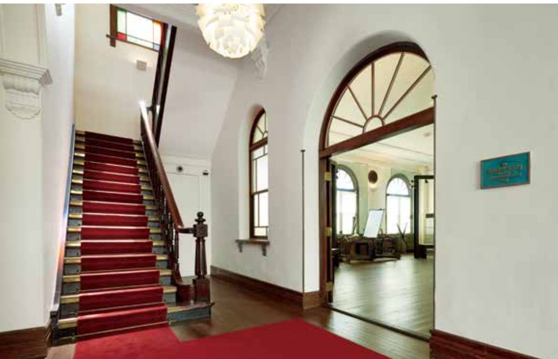
1階のNISSHA印刷歴史館入り口 The entrance of the Nissha Museum of Printing History on the first floor