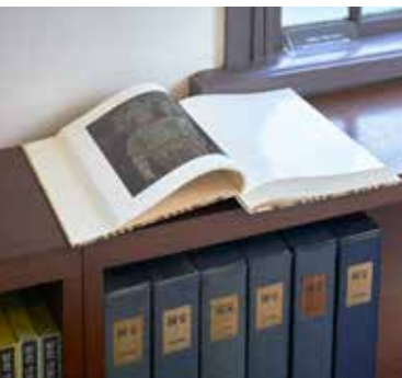
当時の国宝955点すべてを掲載 Features all 955 National Treasures (as they were at the time)