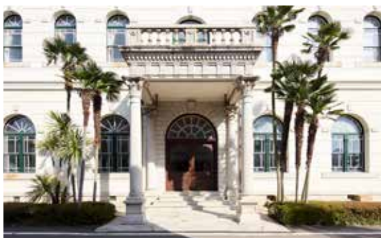
御影石で作られた正面玄関の車寄せとバルコニー Granite portico balcony over the front entrance