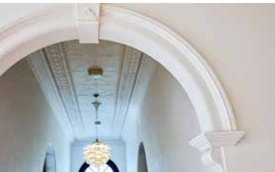
イギリスで作られた型押し鉄板の装飾天井 The decorative pressed-steel ceilings from England