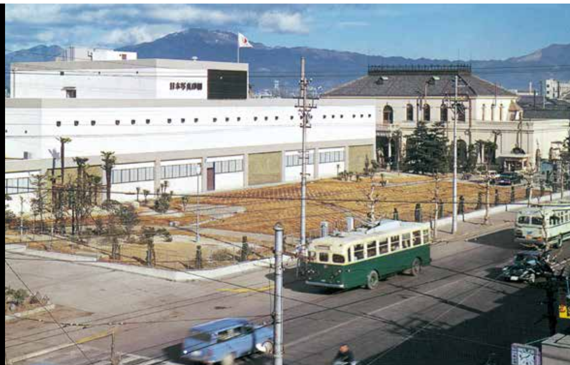
1960年(昭和35年)頃の四条通りと本館 Shijo Street and the Main Hall around 1960