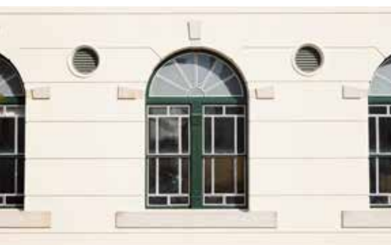
レンガ造りの特徴を表す半円型の窓 The semicircular window that clearly shows the characteristics of brick construction