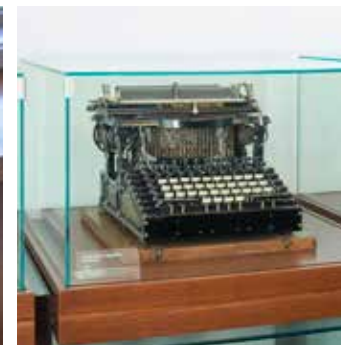
いろいろな形態の欧文タイプライター European-language typewriters in a variety of shapes