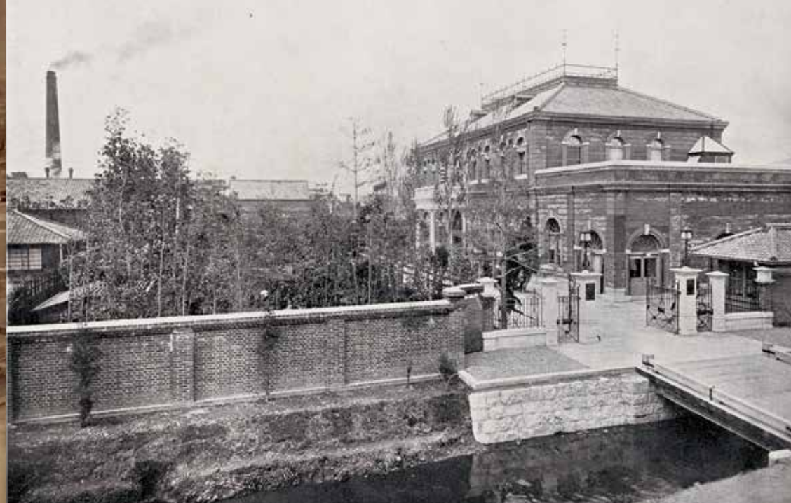
西高瀬川が流れていた1915年(大正4年)当時の正門と本館 The front gate and the Main Hall with the Nishitakase river in 1915