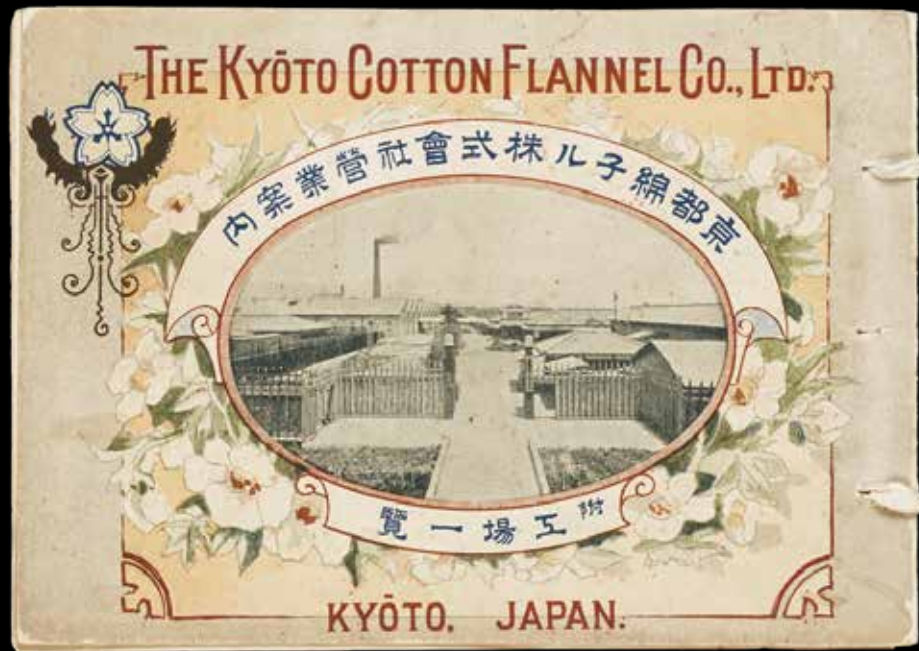
1900年(明治33年)に発行された京都綿ネルの営業案内表紙 Cover of the Kyoto Cotton Flannel business brochure published in 1900