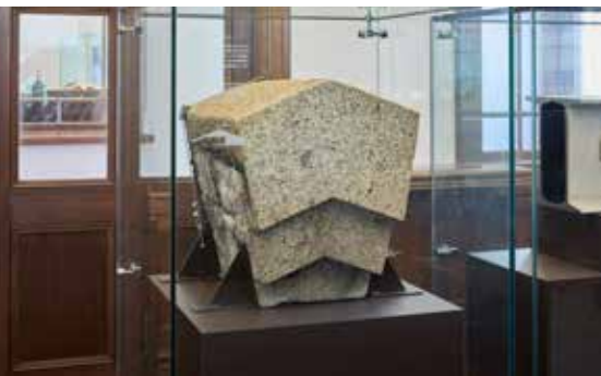
御影石で作られた大屋根の装飾「露盤」 The granite finial base ( roban ) on the roof