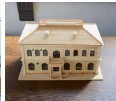
精巧に作られた本館模型 A detailed model of the Main Hall

1897年(明治30年)から始まった京都綿ネルの工場建設には、京都市内で製造されたレンガ310万個が運び込まれたとの記録が残る。しかし1923年(大正12年)の関東大震災以降、日本ではレンガだけの建築が一切禁止されコンクリート造りの建物に切り替わったため、レンガの建物自体が少なくなっている。