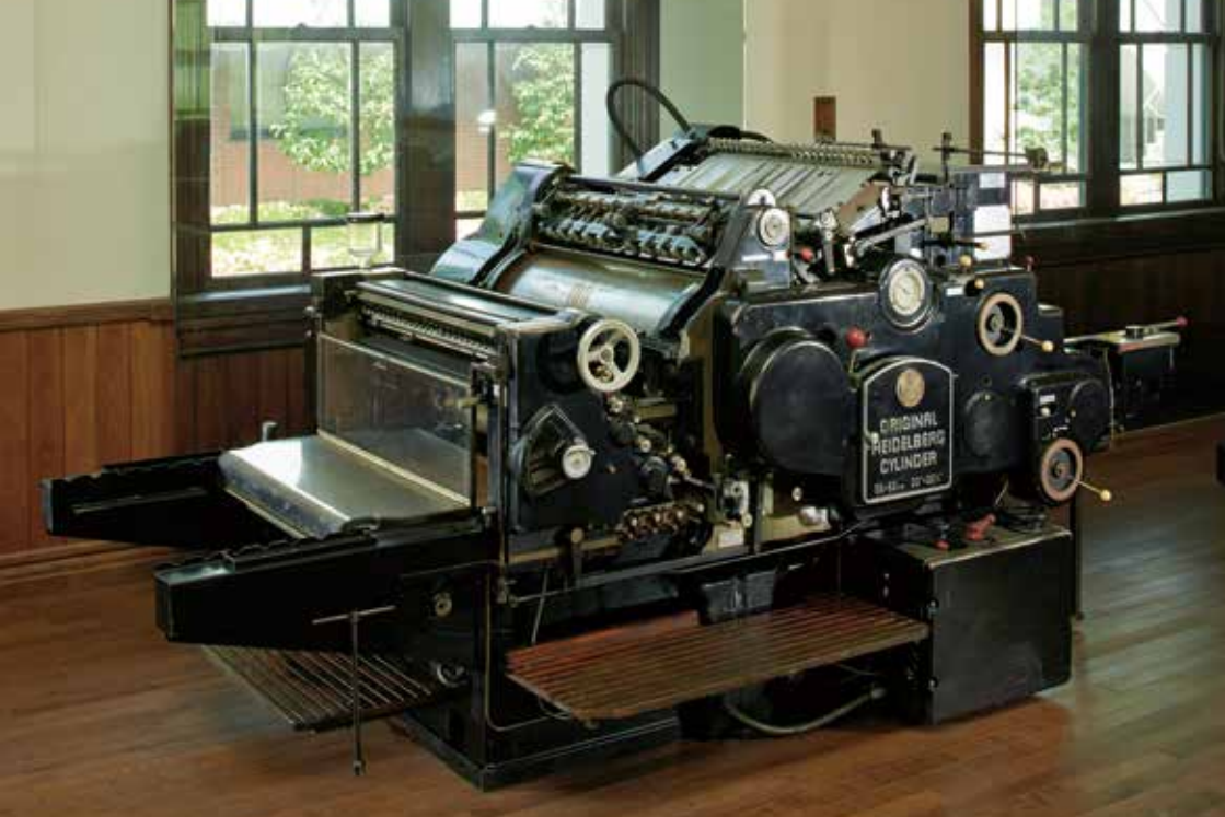
ハイデルベルグ活版印刷機(実機)

In 1798, the German Alois Senefelder developed the technology for lithographic printing. The base was an aqueous stone produced in the Bayern district of Germany comprising mainly calcium carbonate. An image was drawn on the stone with a fatty crayon and then coated with a nitric acid and gum arabic solution. Senefelder discovered that when a roller is then used to apply an oil-based ink, the separation action of water and oil means that the ink adheres. This is said to be the starting point for the planographic (offset) printing of today. Lautrec and other lithographers produced many pieces of work at the time with this printing machine. Experts judge the machine exhibited to be the same model as the type used at Lautrec's printing studio. It was installed after three days of fumigation.