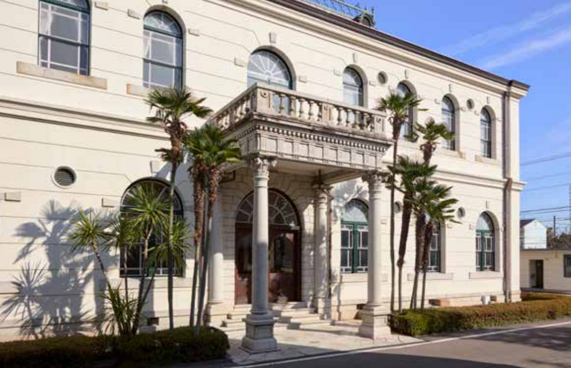
意匠を凝らしたバルコニーを支えるコリント式の石柱 Stone columns with Corinthian order supporting the elaborately designed balcony